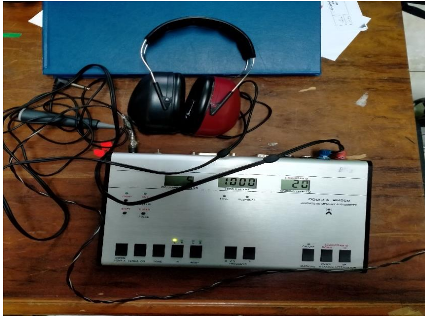
Gambar 3. Audiometri (Alat Pengukur Daya Dengar)

Adapun alat yang digunakan pada penelitian ini yaitu : Sound Level Meter untuk mengukur tingkat kebisingan area kerja, audiometri yang digunakan untuk mengukur tingkat pendengaran pekerja, dan laptop/PC yang digunakan untuk mengelola data. Adapun variabel dari penelitian ini, yaitu: kebisingan lingkungan kerja; kedisiplinan penggunaan APD; dan penurunan daya dengar pekerja.